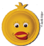
Caneton 4 pages